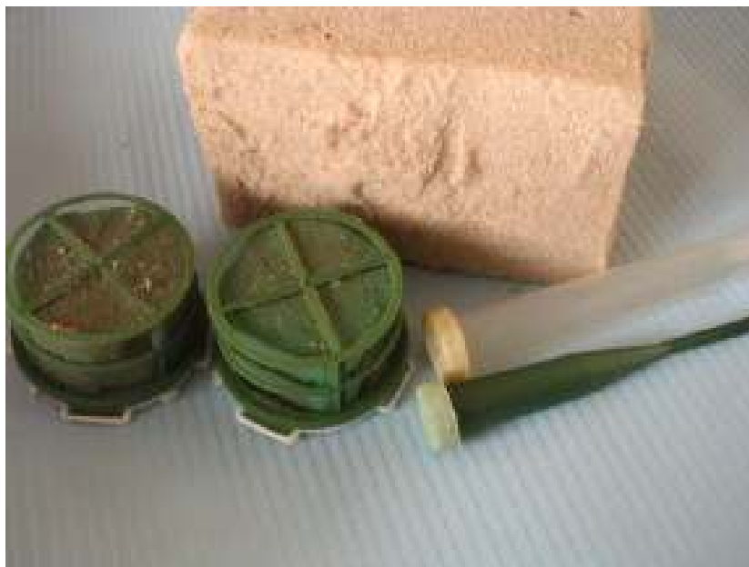
Gąbki oraz fiolki (można w nich umieścić kwiaty).

Niektóre kwiaty są bardziej delikatne, a przez to trudniejsze w układaniu. Jeśli chcemy ułożyć na gąbce kompozycję z kwiatów o miękkich łodygach, to należy usztywnić ich łodygi. Wystarczy przymocować do łodygi, za pomocą taśmy samoprzylepnej, dwa cienkie drewnianki: